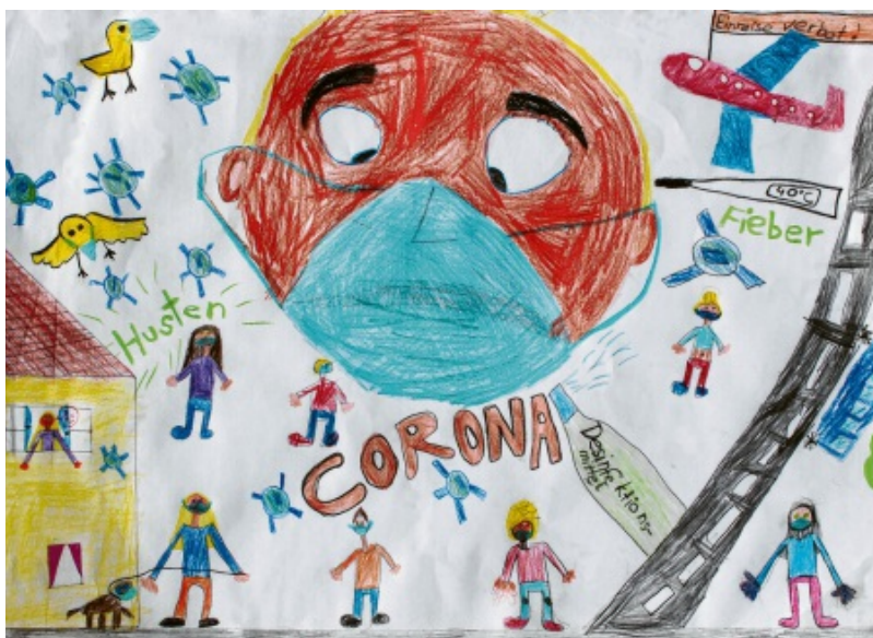
Dieses tolle Bild haben Lilly, Sophie, Lara und Ina gemalt. Die vier Drittklässlerinnen der Leopold-Mozart-Schule in Leitershofen bei Augsburg haben sich am Freitag viele Gedanken zu Corona gemacht. Und sie haben uns auf die Idee gebracht, dass wir die Capito-Leser bitten, uns ihre Corona-Bilder zu mailen.

Hinweis für die Eltern Bitte beachten Sie Hinweise zum Datenschutz und die Informationspflichten nach Art. 13 DSGVO unter augsbu-ger-allgemeine.de/datenschutz oder unter Telefon 0821-777-2355.