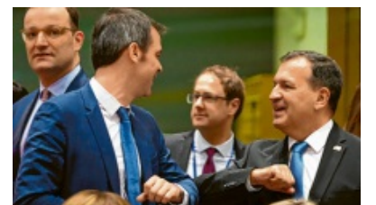
Manche Politiker begrüßen sich gerade mit den Ellenbogen.