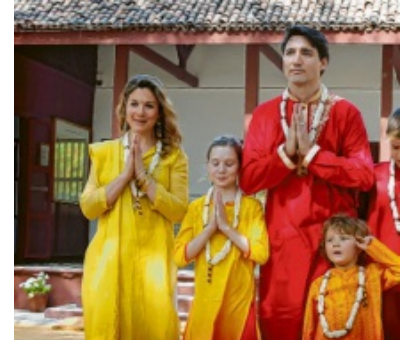
In einigen Ländern Asiens ist Namaste ein weitverbreiteter Gruß.

Keiner jubelt, niemand schwenkt Fahnen – so ist das bei Geisterspielen. Die Bundesligaveren haben zuletzt mehrere davon erlebt. Mit Spielen ohne Zuschauer wollen die Klubs verhindern, dass sich das neue Coronavirus weiter ausbreitet. Die Menschen sollen davor geschützt werden, sich anzustecken. Doch auch mit den Geisterspielen in der ersten und zweiten Bundesliga ist nun Schluss. Das entschied die Deutsche Fußball Liga. Bis 2. April sollen keine Spiele stattfinden. Die Spielzeit vorzeitig beenden will die Liga aber noch nicht. Denn die Vereine verlieren viel Geld, wenn keine Spiele mehr stattfinden, etwa weil sie keine Eintrittskarten mehr verkaufen und Spiele nicht mehr im Fernsehen gezeigt werden. (dpa)