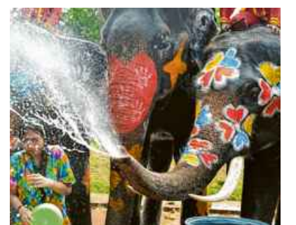
Ein Elefant bespritzt in Thailand einen Touristen während einer Feier zum Wasserfest Songkran.

Diese Stellen an der Autobahn kennt wohl fast jeder. Manche machen auf dem Rückweg vom Urlaub Pause, andere wollen nur schnell auf die Toilette. Dann fährt man mit dem Auto kurz auf eine Autobahnraststätte. Die Lastwagen auf der Raststätte Gräfenhausen im Bundesland Hessen stehen teilweise aber schon seit fast drei Wochen da. Die Lkw-Fahrer streiken und versammeln sich auf dem Parkplatz, um Geld einzufordern. Mittlerweile streiken mehr als 60 Leute auf dem Parkplatz und haben ungefähr 40 Lastwagen mitgebracht. Sie sagen, sie fahren erst weiter, wenn sie für ihre Arbeit Geld bekommen. Denn die Firma zahlt bisher nicht. (dpa)